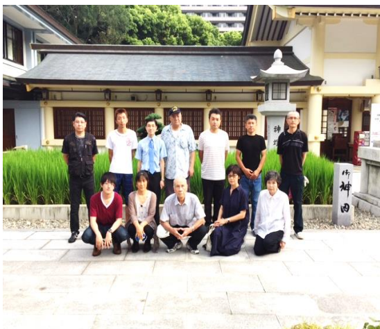
（8月7日 奉仕後に撮影）