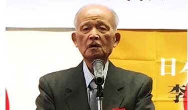
祝辞 塚本三郎氏 (元民社党委員長)