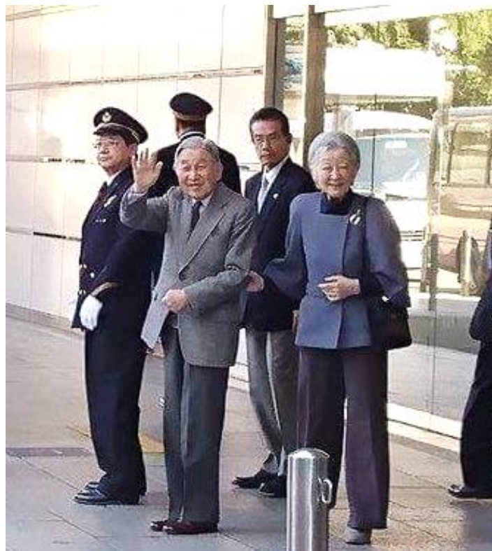
奉迎者にお応えになる両陛下