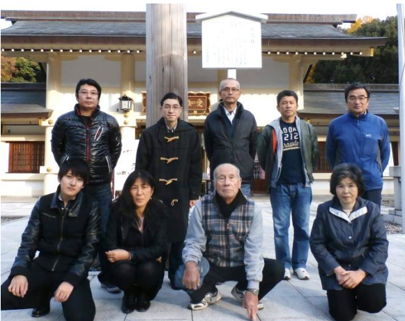
(12月4日 奉仕後に撮影)