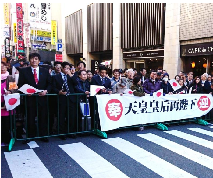
お出ましを待つ奉迎者

□天皇皇后両陛下におかれては、去る、11月16日～18日の3日間、愛知県と長野県を行幸啓あそばされた。日本会議愛知県本部では、名古屋駅にてお出迎えとお見送りをさせていただき、1,000本の国旗小旗も配布。両陛下は、愛知県の犬山市の入鹿池と小牧市のメナード美術館をご視察になり、沿道各所においても多くの人々より奉送迎をお受けになられた。