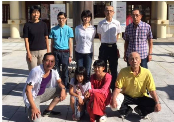
(9月3日 奉仕後に撮影)