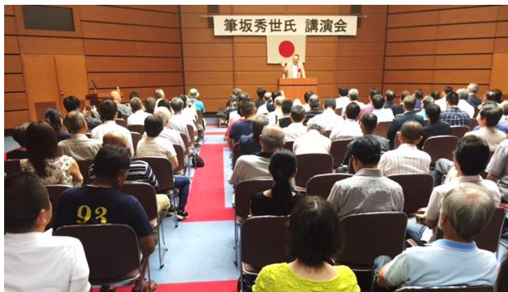
大盛況となった筆坂秀世氏講演会

□本冊子は2つのパートに分かれており、第1部は世界中で繰り広げられた共産主義勢力による殺戮の実態と、日本共産党の革命戦略などを取り上げてあり、第2部では戦前、戦後における日本共産党の組織文書などが掲載してある。