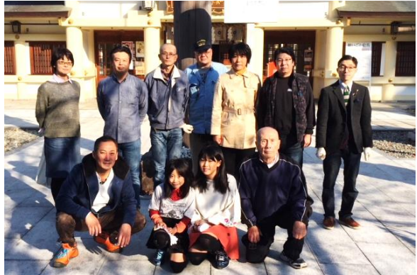
（11月5日 奉仕後に撮影） ●「日本の息吹」を引き続きご購入くださいますようお願いいたします。