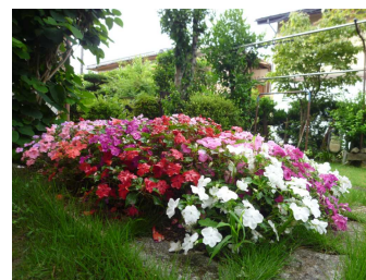
春菊収穫後の花壇