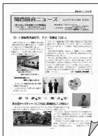
関西協会ニュース第48号