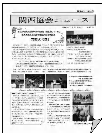
関西協会ニュース第47号