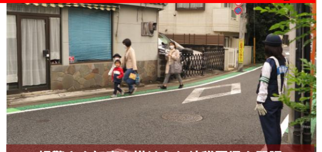
婦警さんに声を掛けられ幼稚園児も緊張

10日（水）午前7時半過ぎ、世田谷警察署のミニパトが到着、婦警さんなど4名の登校児童の交通安全を支援して下さいました。登校する学童や幼稚園に向かう児童は、いつもと違い婦警さんに「おはようございます」と声を掛けられ、少し緊張気味に「おはようございます」と返していました。毎月、世田谷警察署からの支援を頂いていますが、今月は他の日にも数回、赤色灯を点滅させながらパトロールカーやミニパトが巡回しました。