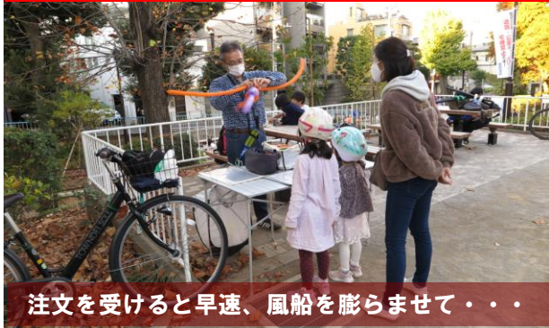
注文を受けると早速、風船を膨らませて・・・

13日（土）午後3時過ぎ、何時ものように鶴ヶ久保公園に行くと、子どもたちが上の広場に集まっていた。