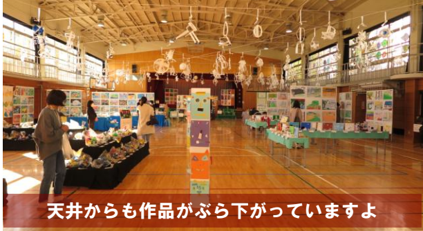
天井からも作品がぶら下がっていますよ

13日（土）、旭小学校の体育館で開催中の《令和3年度展覧会》を見学させて頂きました。