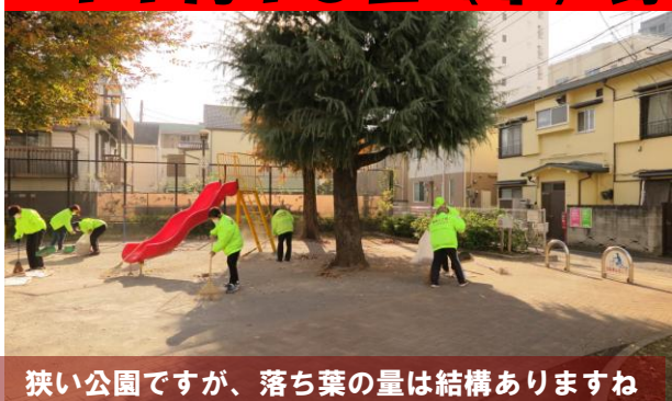
狭い公園ですが、落ち葉の量は結構ありますね

18日（木）午前8時半過ぎ、野沢2丁目公園に12名が集まり、定例の清掃活動を行いました。