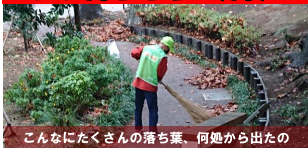
こんなにたくさんの落ち葉、何処から出たの

11月22日（月）午前8時半過ぎ、鶴ヶ久保公園に10名が集まり、清掃活動が行われました。