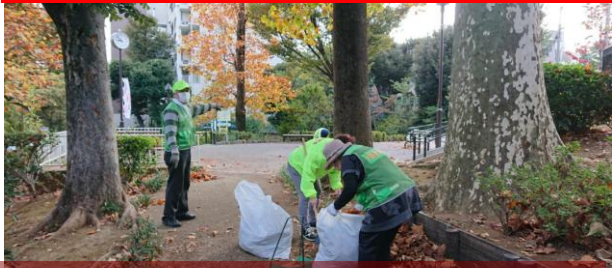
上の広場のユリノキの葉は大量でした

8日（月）午前9時前、鶴ヶ久保公園に13名が集まり、清掃活動を行いました。上の広場や通路にはたくさんのユリノキの大きな枯れ葉が落ちており、集めた量は700のゴミ袋9つになりました。秋から冬にかけて枯れ葉を落とす落葉樹にはまだまだたくさん葉っぱが残っており、しばらくは枯れ葉との闘いになりそうですね。久々の大量の収穫でお疲れ様でした。