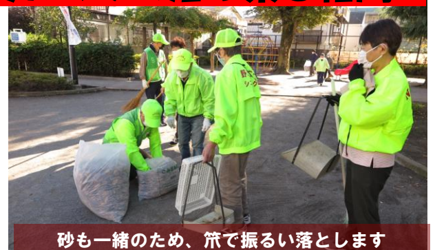
砂も一緒のため、箒で振り落としします

11日（木）午前9時前、野沢2丁目公園に13名が集まり、清掃活動を行いました。相変わらずたくさんの落ち葉があり、掃き集め、集めた量は450のゴミ袋2つになりました。鶴ヶ久保公園に比べれば1/5ほどの広さの公園ですが、大きな桜の木があり、砂場や滑り台、ブランコもあり、遊具も充実しているため、子どもたちには人気の公園。唯一泣き所はトイレが無いので、子どもたちには見せられない大人が行う“オープントイレ”、世田谷区の公園管理事務所に再三申し入れています、実現できていません。