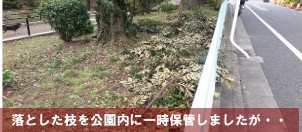
落とした枝を公園内に一時保管しましたが・・・

7日（日）午後、鶴ヶ久保公園では数人の子供たちが、枝を振り回して“チャンバラごっこ”のようにして遊んでいました。よく見ると前日切り落として鶴ヶ久保公園内に置いたM宅の枝だったため、取上げ、残った枝と一緒にゴミ袋に入るよう鋸で短く切り、片づけました。伐採直後にゴミ袋に入れて廃棄できるように処理すべきだったと反省しています。