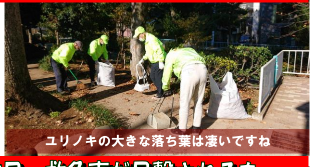
ユリノキの大きな落ち葉は凄いですね

また、清掃活動中、日頃家族で鶴ヶ久保公園を利用している男性が飛び入り参加し、一緒に掃き掃除を行いました。