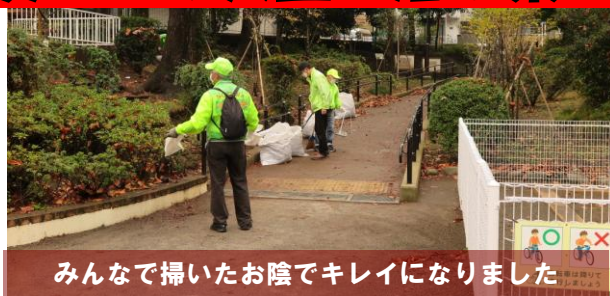
みんなで掃いたお陰でキレイになりました

見上げるとまだユリノキには大きな葉っぱがたくさん残っていますので、いましばらくは落ち葉が続きますね。