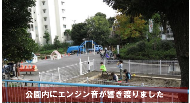
公園内にエンジン音が響き渡りました

同じく1日(月)午後、鶴ヶ久保公園内に鳴り響くエンジン音、世田谷区の公園管理事務所が手配した業者さんがエンジン付きブロワーなどを駆使して清掃作業を行っていました。野沢2丁目町会で毎週行っている清掃活動では手が届かない植込みの中に残る落ち葉や箒では取り除くことができない植込みの木々の枝などに絡んだ落ち葉をブロワーで吹き飛ばし、箒や熊手を手にした別の職人さんが掃き集めるチームワークで見違えるようにキレイになりました。