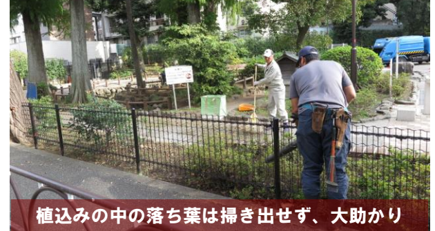
植込みの中の落ち葉は掃き出せず、大助かり

同じく1日(月)午後、鶴ヶ久保公園内に鳴り響くエンジン音、世田谷区の公園管理事務所が手配した業者さんがエンジン付きブロワーなどを駆使して清掃作業を行っていました。野沢2丁目町会で毎週行っている清掃活動では手が届かない植込みの中に残る落ち葉や箒では取り除くことができない植込みの木々の枝などに絡んだ落ち葉をブロワーで吹き飛ばし、箒や熊手を手にした別の職人さんが掃き集めるチームワークで見違えるようにキレイになりました。