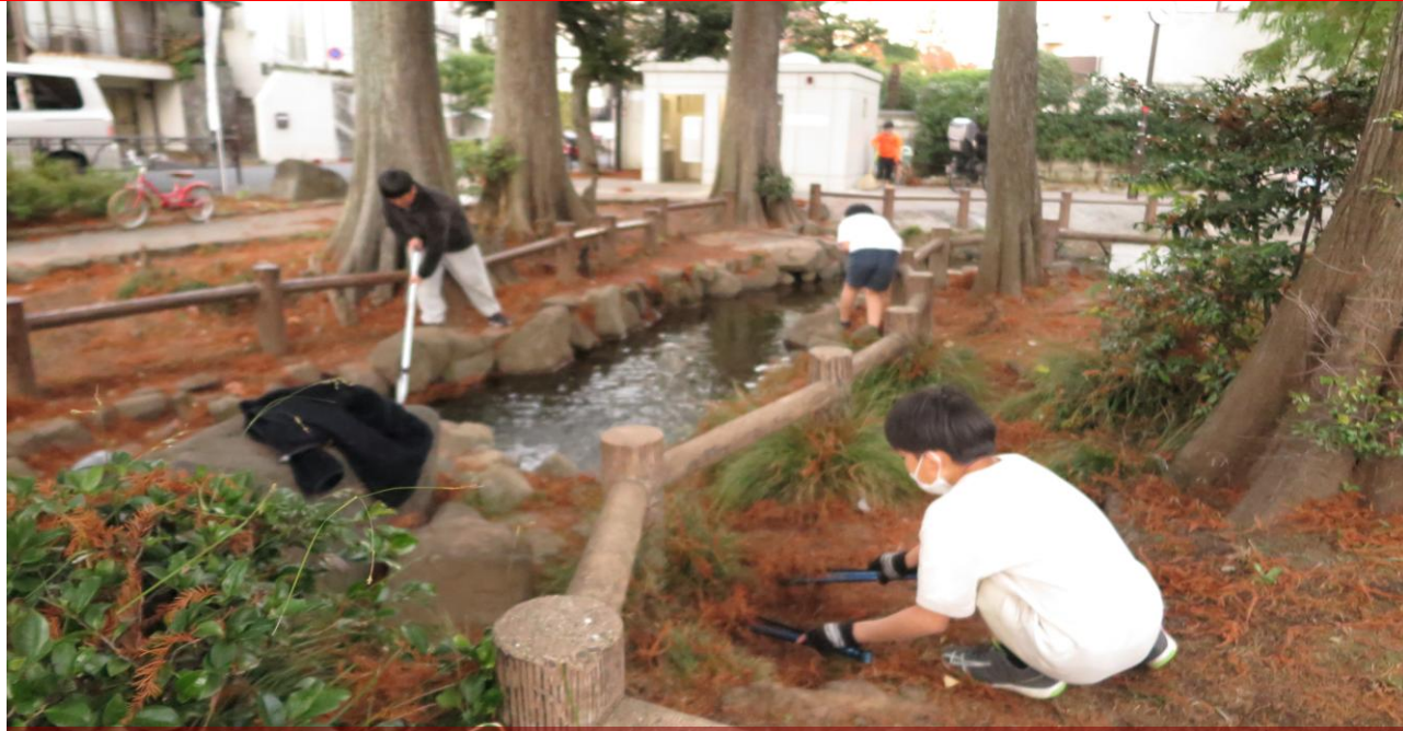
11月24日(水)と27日(土)、鶴ヶ久保公園の池周囲で“落羽松”落ち葉を集める皆さん