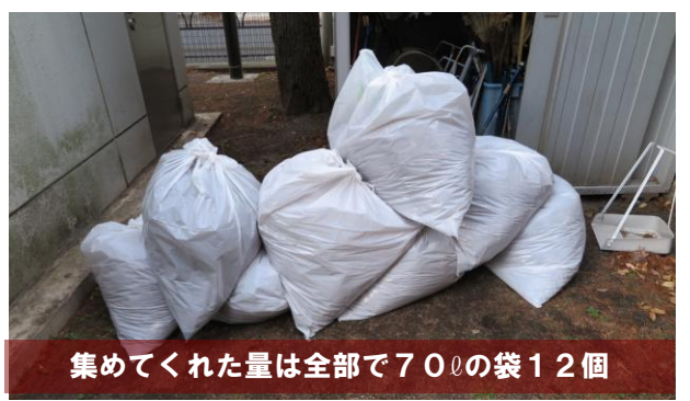
集めてくれた量は全部で700の袋12個

池の上を見上げると木にはまだまだ葉が付いており、しばらく落ち葉との格闘が続きそうです。