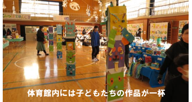
体育館内には子どもたちの作品が一杯

右手奥には5年生の絵と作品は「ナマエ・デ・アート」と「踊る人形」は楽しいですね。最後の6年生の「お気に入りの風景」と「ドリーム・ルーム」が展示されており、楽しく拝見しました。