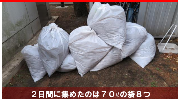
2日間に集めたのは70ℓの袋8つ

2時間ほど格闘して集めた枯れ葉は70ℓのゴミ袋に4つ分、池の周囲の落ち葉は軽いのですがかさ張り、池から掬い上げた落ち葉は重いのが泣き所、ズッシリしたゴミ袋を、週明けのゴミ収集日に出すため、一時倉庫に入れました。