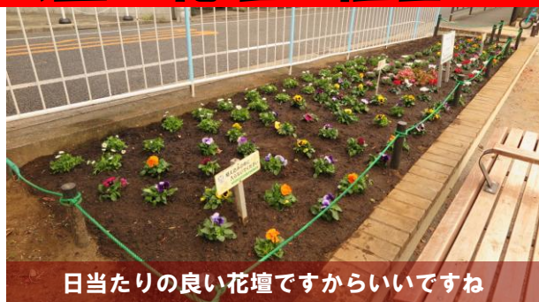
日当たりの良い花壇ですからいいですね

下馬まちづくりセンターの支援で行われた植替えでは、夏から秋にかけて咲いた花々の枯れた根やゴミや小石を取除き、耕した後、腐葉土や肥料を撒き、冬に向けて“ノースポール”、“シクラメン”はじめ色とりどりの“パンジー”などが植えられ、最後にたっぷり水やりを行い、終了しました。