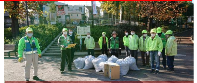
大量の落ち葉で久々の700の袋9つ

8日（月）午前9時前、鶴ヶ久保公園に13名が集まり、清掃活動を行いました。上の広場や通路にはたくさんのユリノキの大きな枯れ葉が落ちており、集めた量は700のゴミ袋9つになりました。秋から冬にかけて枯れ葉を落とす落葉樹にはまだまだたくさん葉っぱが残っており、しばらくは枯れ葉との闘いになりそうですね。久々の大量の収穫でお疲れ様でした。