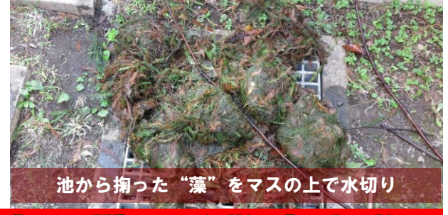
池から掬った“藻”をマスの上で水切り

11月2日(火)午後3時過ぎ、通常の掃除では手の回らない池を覗くと“藻”が猛烈に繁殖しており、手網を使って取除きました。半月ほど前に公園管理事務所が手配した業者さんが高圧洗浄機で“藻”を根っこから吹き飛ばし、洗浄してくれたはずですが、底にこびりついていた根が再び活動し、わずかな2週間ほどで一面を覆うほどに繁殖、復活してしまいました。