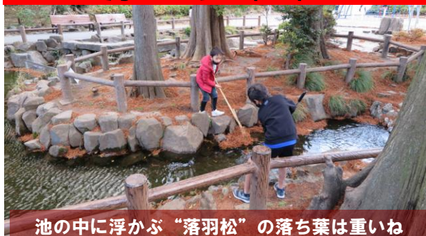
池の中に浮かぶ“落羽松”の落ち葉は重いね

27日（土）午後3時過ぎ、鶴ヶ久保公園に池の様子を見に行くと、案の定、池一面を“落羽松”の枯れ葉が覆っていました。