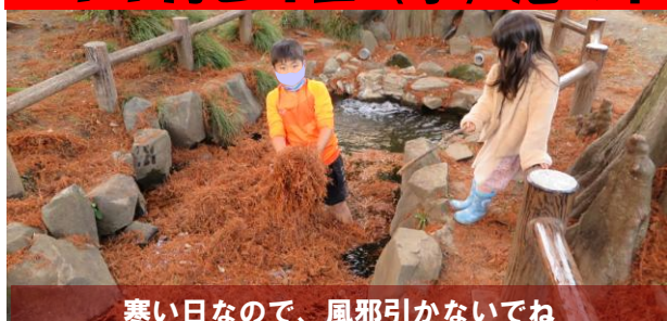
寒い日なので、風邪引かないでね

24日（水）午後3時過ぎ、鶴ヶ久保公園の池の様子を見ると、真っ赤に染まった“落羽松”の枯れ葉が池一面、覆っていました。