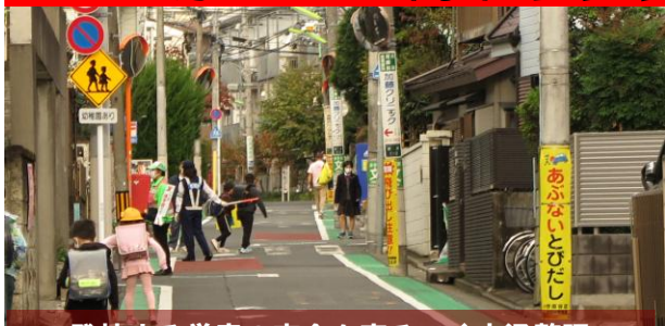
登校する学童の安全を守るべく交通整理

10日（水）午前7時半過ぎ、世田谷警察署のミニパトが到着、婦警さんなど4名の登校児童の交通安全を支援して下さいました。登校する学童や幼稚園に向かう児童は、いつもと違い婦警さんに「おはようございます」と声を掛けられ、少し緊張気味に「おはようございます」と返していました。毎月、世田谷警察署からの支援を頂いていますが、今月は他の日にも数回、赤色灯を点滅させながらパトロールカーやミニパトが巡回しました。