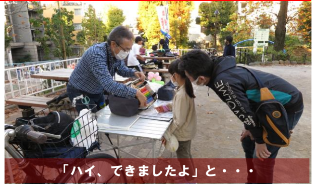
「ハイ、できましたよ」と・・・