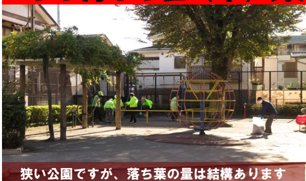
狭い公園ですが、落ち葉の量は結構あります

11日（木）午前9時前、野沢2丁目公園に13名が集まり、清掃活動を行いました。相変わらずたくさんの落ち葉があり、掃き集め、集めた量は450のゴミ袋2つになりました。鶴ヶ久保公園に比べれば1/5ほどの広さの公園ですが、大きな桜の木があり、砂場や滑り台、ブランコもあり、遊具も充実しているため、子どもたちには人気の公園。唯一泣き所はトイレが無いので、子どもたちには見せられない大人が行う“オープントイレ”、世田谷区の公園管理事務所に再三申し入れています、実現できていません。