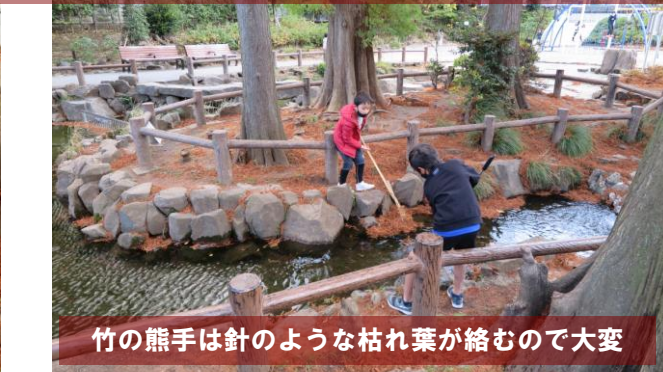
竹の熊手は針のような枯れ葉が絡むので大変

11月に入り、鶴ヶ久保公園の落葉樹は一斉に葉を落とし始め、毎週月曜日の掃除のたびに、夏や初秋では考えられないほどの落ち葉があり、収集日に出す袋の数が大幅に増えました。