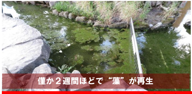
僅か2週間ほどで“藻”が再生

11月2日(火)午後3時過ぎ、通常の掃除では手の回らない池を覗くと“藻”が猛烈に繁殖しており、手網を使って取除きました。半月ほど前に公園管理事務所が手配した業者さんが高圧洗浄機で“藻”を根っこから吹き飛ばし、洗浄してくれたはずですが、底にこびりついていた根が再び活動し、わずかな2週間ほどで一面を覆うほどに繁殖、復活してしまいました。