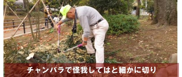
チャンバラで怪我してはと細かに切り

7日（日）午後、鶴ヶ久保公園では数人の子供たちが、枝を振り回して“チャンバラごっこ”のようにして遊んでいました。よく見ると前日切り落として鶴ヶ久保公園内に置いたM宅の枝だったため、取上げ、残った枝と一緒にゴミ袋に入るよう鋸で短く切り、片づけました。伐採直後にゴミ袋に入れて廃棄できるように処理すべきだったと反省しています。