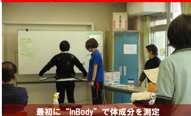
最初に“InBody”で体成分を測定

25日（木）午後2時半、下馬区民集会所に22名が参集、身近なまちづくり推進協議会健康づくり部会が主催する“健康体操教室”が開催されました。