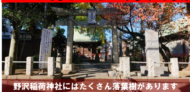
野沢稲荷神社にはたくさん落葉樹があります

24日（水）午前8時、野沢稲荷神社に野沢町内の皆さんが集まり、清掃活動を行いました。