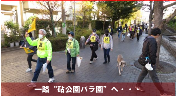
一路「砧公園バラ園」へ・・・

14日（日）午前9時20分、新玉川線用賀駅近くの「用賀くすのき公園」に身近なまちづくり推進協議会の健康づくり部会が主催する《秋の歩こう会》に参加の48名が集合し、スタートしました。