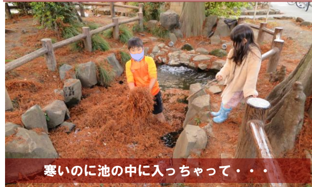
寒いのに池の中に入っちゃって・・・