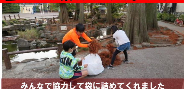
みんなで協力して袋に詰めてくれました

池の周囲の落ち葉も一緒に集めてくれた結果、なんと70ℓのゴミ袋4つになりました。