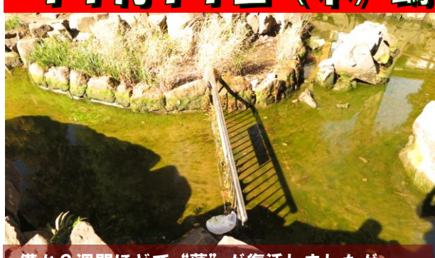
僅か2週間ほどで“藻”が復活しましたが・・・

同じく11日、午後、鶴ヶ久保公園からエンジン音が聞こえてきたので行ってみると、公園管理事務所が手配した業者さんが高圧洗浄機を使って“セセラギ”や“池”の洗浄作業をしていました。夏の間、池の水面を覆っていた“藻”も寒くなってきたためか、勢いを無くしましたが、底に溜まったヘドロなどは通常の清掃活動では除去できませんので、業者さんの高圧洗浄機が頼りです。午前中から水を抜き始め、高圧洗浄機で“藻”を根こそぎ吹き飛ばし、キレイになった池に水が溜まると早速、子どもたちが入って遊びました。