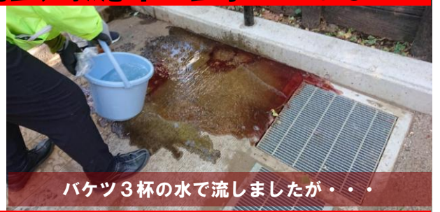
バケツ3杯の水で流しましたが・・・

14日（日）夜7時頃、公園入口に停まる救急車が目撃されており、世田谷消防署にケガ人を確認しようとうと、その時間に管内の救急車の出動記録は無いとのこと。偽救急車？・・・怪奇現象かな？