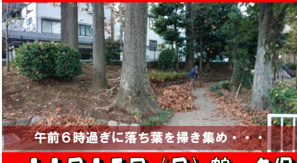
午前6時過ぎに落ち葉を掃き集め・・・

15日（月）午前8時半過ぎ、定例の清掃活動の前に、午前6時過ぎ、鶴ヶ久保公園の落ち葉を掃いている女性がありました。