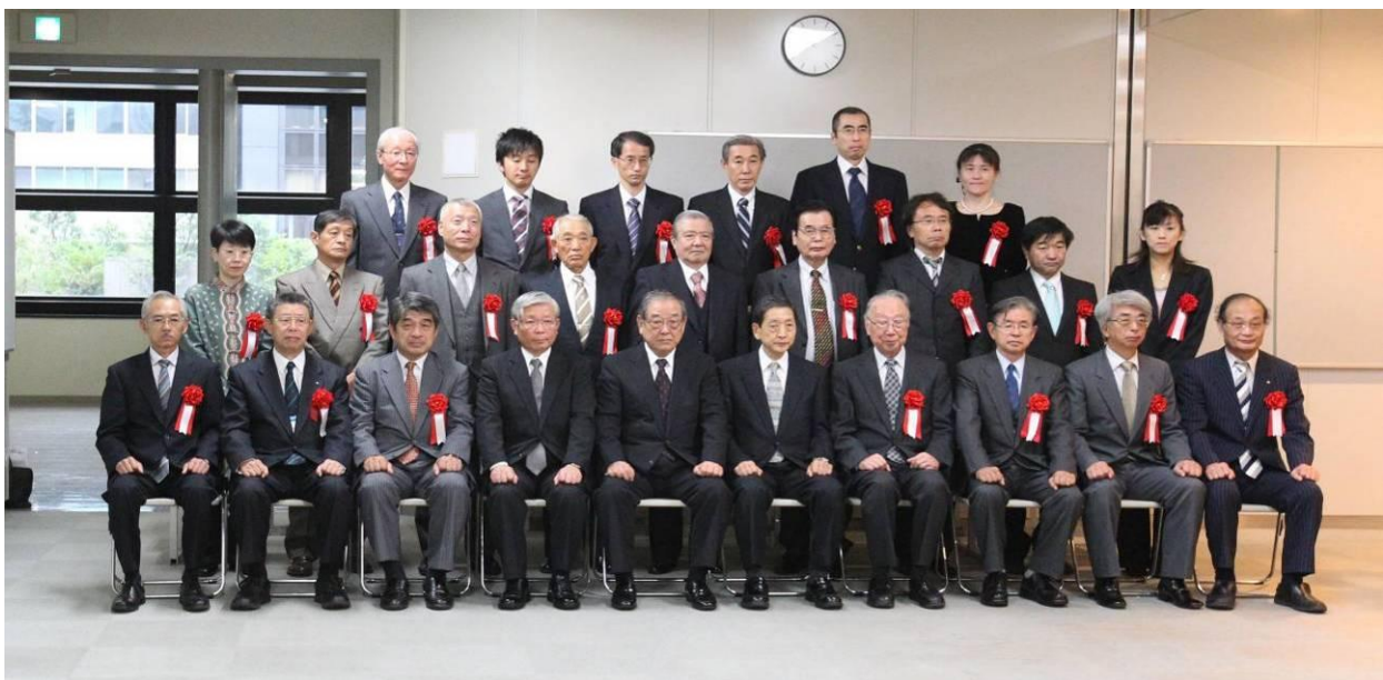
表彰式終了後の記念撮影

続いて工学院大学八王子キャンパス隣にある工学院大学附属中学校や高等学校の学事が報告されました。